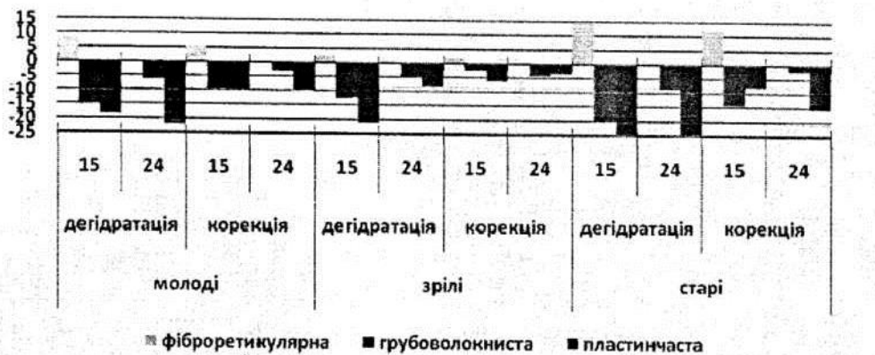
Рис 2. Відсоткове співвідношення тканин регенерату великогомілкових кісток експериментальних щурів різного віку

За допомогою растрової електронної мікроскопії на 15 добу спостерігається заповнення дефекту паралельно розташованими колагеновими волокнами, між якими знаходилася фіброретикулярна тканина. Новоутворена кісткова тканина виявляється в крайових відділах регенерату, представлена сіткою кісткових трабекул з високою щільністю остеобластів та поодинокими остеоцитами. Кісткового зрощення відламків не спостерігалось. Рентгенівський мікроаналіз поверхні травмованої кістки підтверджує ефективність застосування мукосату у молодих тварин, вміст кальцію у місці травми більше, ніж при важкому ступені на 6,25% ( p < 0,05 ), але нижче за контроль показники на 7,15% ( p < 0,05 ). Аналогічна картина відбувається з фосфором. На межі дефекту та на віддалені від нього рівень кальцію і фосфору залишається вищим за контрольні показники, але нижчим показників при важкому ступені.